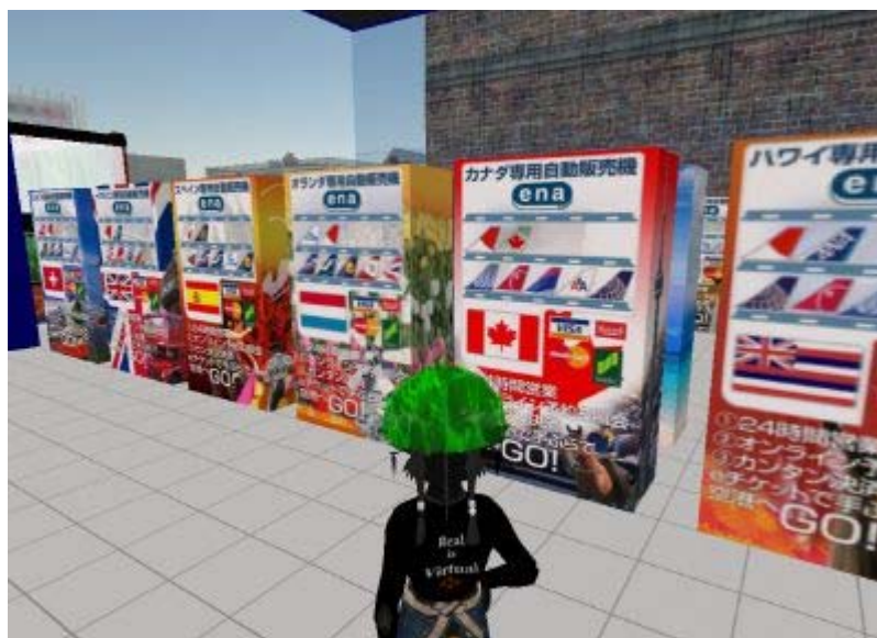
どの国にしようかなあ。