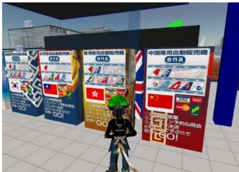
国・地域別に利用可能な航空会社の尾翼マークを陳列しています。