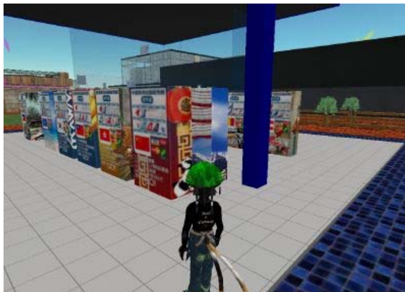
パネルから想像していたのは、数台程度の自動販売機だったのですが、実際には20台近く置いてありました。